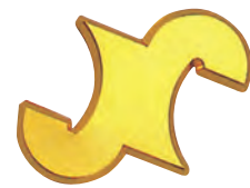
商工会議所マーク 大(85φ)