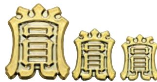
賞大 (40×33) 中 (26×22) 小 (23×20)