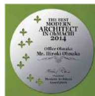
AKL-1709 鶺鴒黄 Hiwamoegi