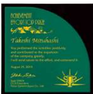
AK-1625 青竹 Aotake

AKL-1708~1713は上記6種類の中から模様をご指定ください。(模様無しも選択可)