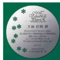
AKL-1708 青竹 Aotake