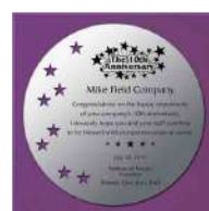
AKL-1712 菖蒲 Ayame