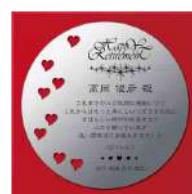
AKL-1711 銀朱 Ginshu