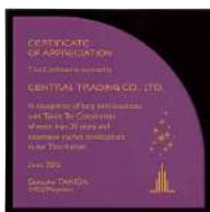
AK-1629 菖蒲 Ayame