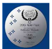
AKL-1713 紺青 Konjou