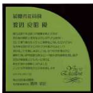
AK-1626 鶺鴒黄 Hiwamoegi