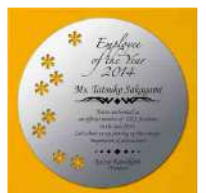
AKL-1710 山吹 Yamabuki