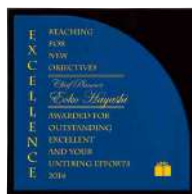
AK-1630 紺青 Konjou