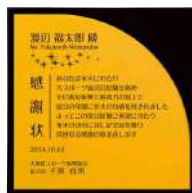
AK-1627 山吹 Yamabuki