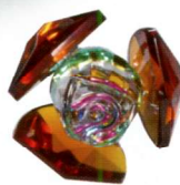
WA-0008 ● Amber (アンバー)