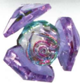
WA-0007 ● Lavender (ラベンダー)