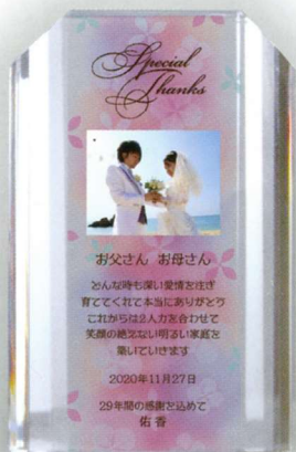
● 01 Pink (ピンク)