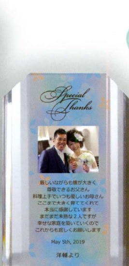
● 02 Blue (ブルー)