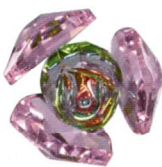
WA-0009 ● Pink (ピンク)