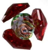
WA-0006 ● Red (レッド)